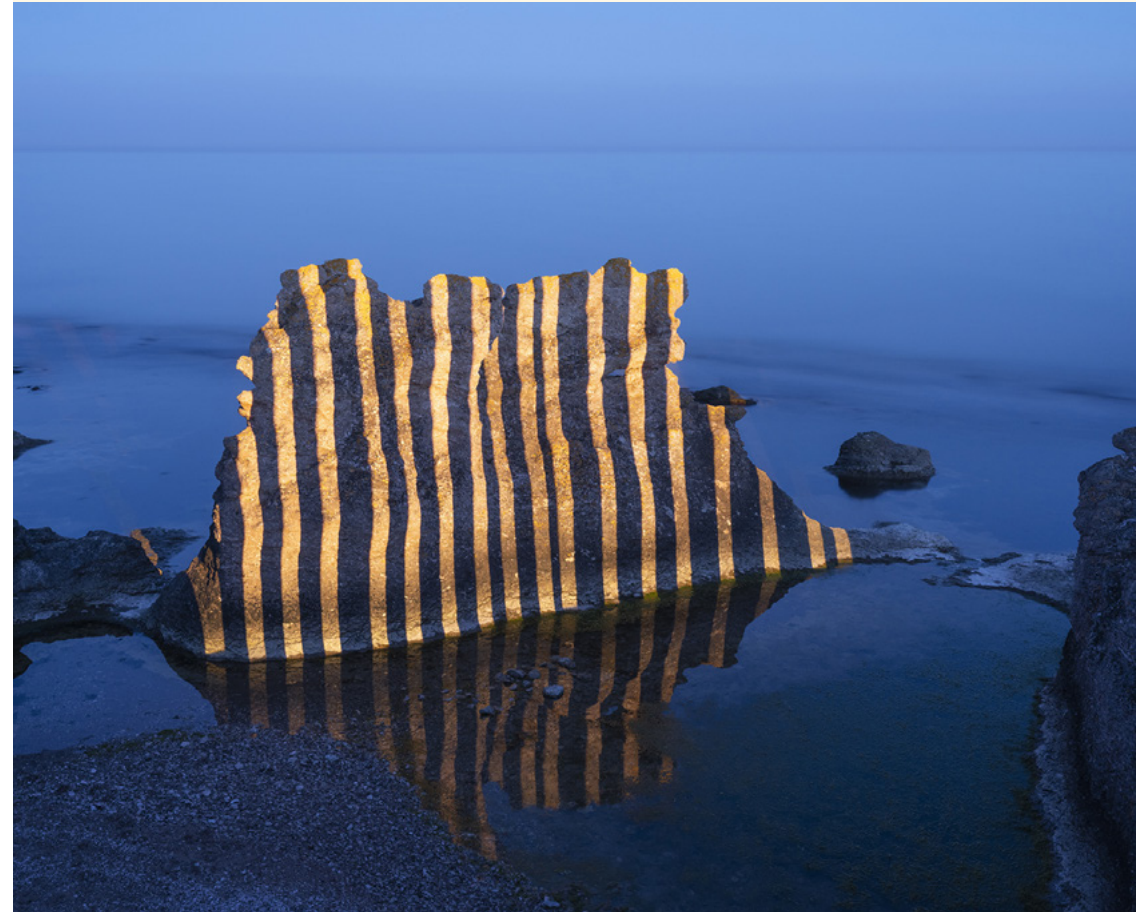
Daan Zuiderwijk, Parallel #04, Hamra, foto, 2024, 80 x 100 cm

Zuiderwijk maakt zijn foto's in de nacht en zoekt in de duisternis naar de veelbelovende plek. Op de foto's zijn projecties te zien die hij projecteert op rotsformaties en bomen. Hij doet zijn ingrepen met gekleurde lampen en laserpennen. Door deze ingrepen veranderen het bos, de berg en de klif van gedaante. De patronen symboliseren een menselijke neiging tot orde en structuur. Een structuur die mensen creëren om de wereld om zich heen beter te kunnen begrijpen. Zuiderwijk wil met zijn werk een poging doen om contact te maken met de krachten in de natuur die ons mensen werkelijk vreemd zijn.