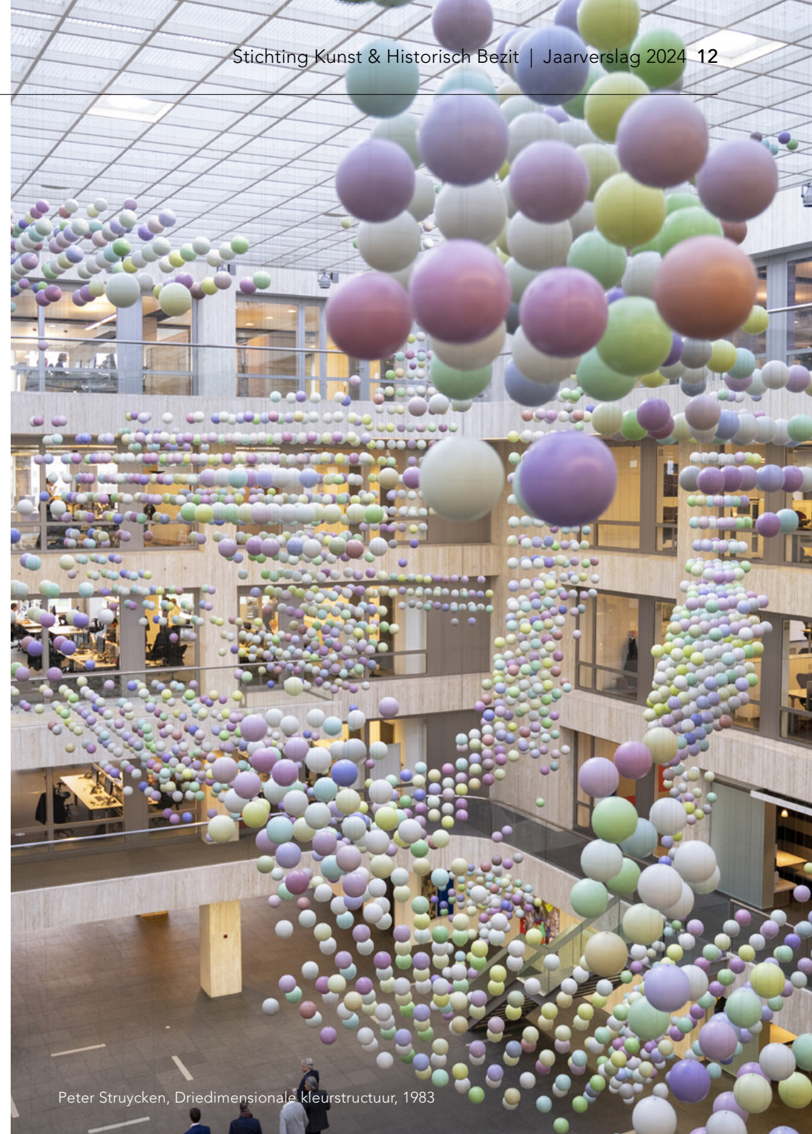
Peter Struycken, Driedimensionale kleurstructuur, 1983

Het kunstwerk van Peter Struycken is in 1983-1986 speciaal gemaakt voor het atrium van het Aegon-kantoor. Mogelijk kan het op deze locatie in zijn oorspronkelijke vorm blijven hangen. Zo niet, dan probeert a.s.r. een nieuw onderkomen voor 'de bollen' te vinden. Dit gebeurt in overleg met de kunstenaar. Zijn belangrijkste wens is een ruimte die minimaal even groot is zodat het kunstwerk niet wordt ingesnoerd of zelfs verkleind. De hal in a.s.r.-kantoor Utrecht valt daarmee af.