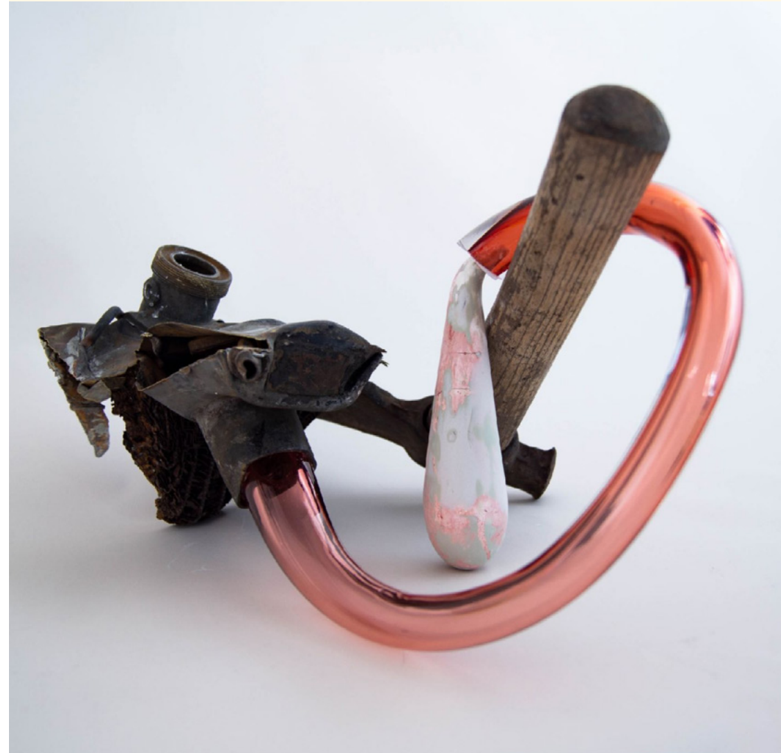
Kira Fröse, Door de mand gevallen I , glas, koper, 18 x 9 x 9 cm, 2022 en Gegenstromanlage , glas, gips, polyester, pigment, bijl, schroot, 24 x 42 x 34 cm, 2024

Fröse combineert wat standaard niet bij elkaar hoort en ontdoet vertrouwde voorwerpen uit het dagelijks leven van hun verleden. Zo ontstaan kunstwerken met een eigen verhaal over confrontatie en tegenstellingen, zoals vast en vloeiend, star en dynamisch, esthetisch en afstotend.